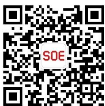
复旦大学经济学院