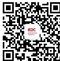
复旦大学经济学院教育发展中心